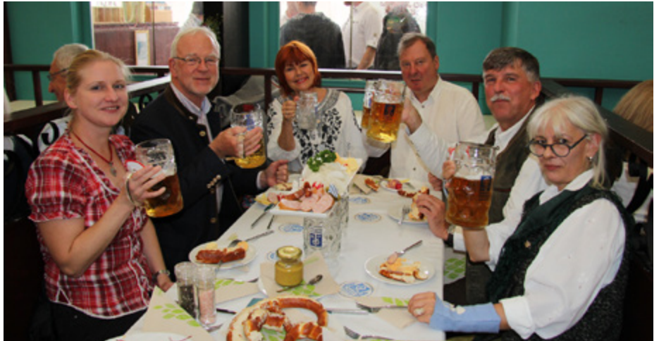
Gute Laune und gute Gespräche am Tisch des Präsidenten.

Die Verbindung mit der Bayerischen Staatszeitung ist in den vergangenen Jahren immer enger geworden. So erhält jeden Monat ein Vorstandsmitglied der Kammer die Gelegenheit, sich zu einem für die Kammer wichtigen Thema zu äußern.