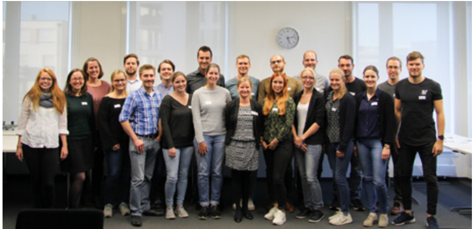
Diese 20 jungen Ingenieurinnen und Ingenieure ergatterten einen Platz im Traineeprogramm.

Das Traineeprogramm wird von Jahr zu Jahr bekannter, auch über die Grenzen Bayerns hinaus. Da das Format deutschlandweit einzigartig ist, steigt der Zulauf aus den angrenzenden Bundesländern stetig. Dem aktuellen Trainee-Jahrgang gehören nun zwei Teilnehmer aus Baden-Württemberg sowie einer aus Sachsen an. Zwei Teilnehmer kommen aus dem TGA-Bereich, der zuletzt im Traineeprogramm stärker berücksichtigt wurde.