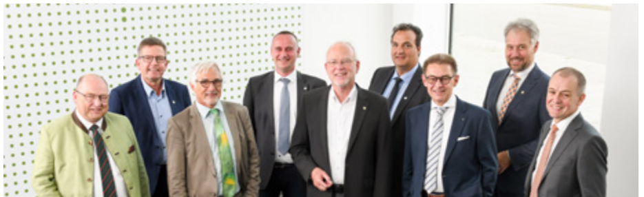
Der Vorstand der Kammer verabschiedete in seiner letzten Sitzung u.a. eine Compliance-Richtlinie.

Im Arbeitskreis Baustellenverordnung gibt es einen Wechsel. Dipl.-Ing. Univ. Ale-