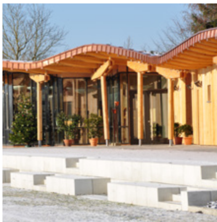
Holz: Nachhaltig und schön.

Veranstalter sind die Ingenieurakademie Bayern und das Netzwerk C.A.R.M.E.N. e.V. Die Regierungen von Niederbayern und der Oberpfalz, die Stadt Regensburg und die Bayerischen Staatsforsten sind als Partner im Boot.