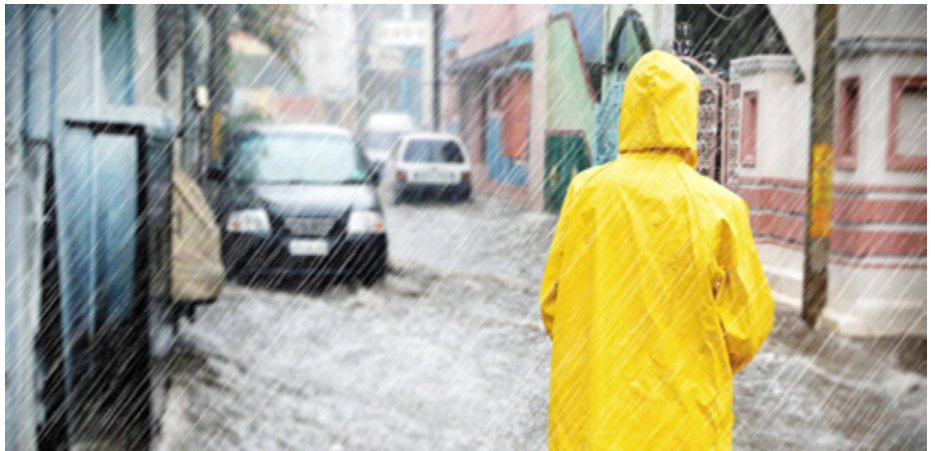
Eine kluge Stadtplanung kann die Folgen heftiger Regenfälle abmildern.