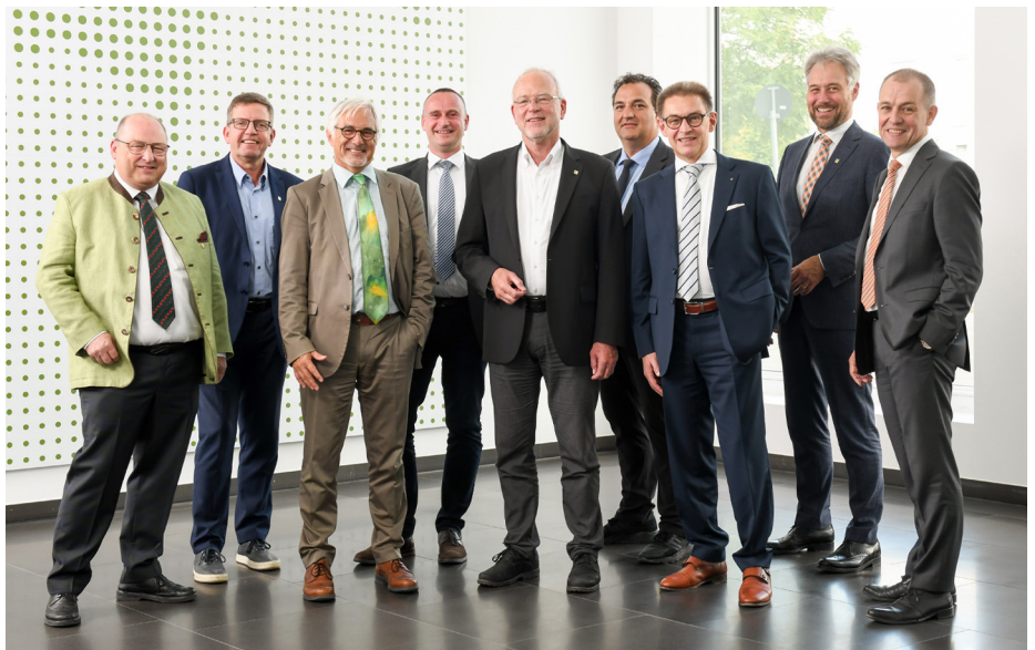
Der alte und neue Vorstand der Bayerischen Ingenieurekammer-Bau (hier auf einem älteren Foto).

Dem Vorstand gehören Inhaber kleinerer wie größerer Büros an, sie kommen aus dem ländlichen Raum wie aus den Ballungsgebieten. Außerdem sind mit Mi-