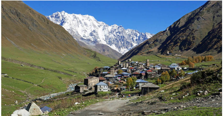
Das Bergdorf Ushguli im Großen Kaukasus.

Herr Keilig stellte außerdem eine komplexe Großhangbewegung in der Nähe von Tiflis vor, die 2015 zu einer „flash flood“ führte, die große Schäden in