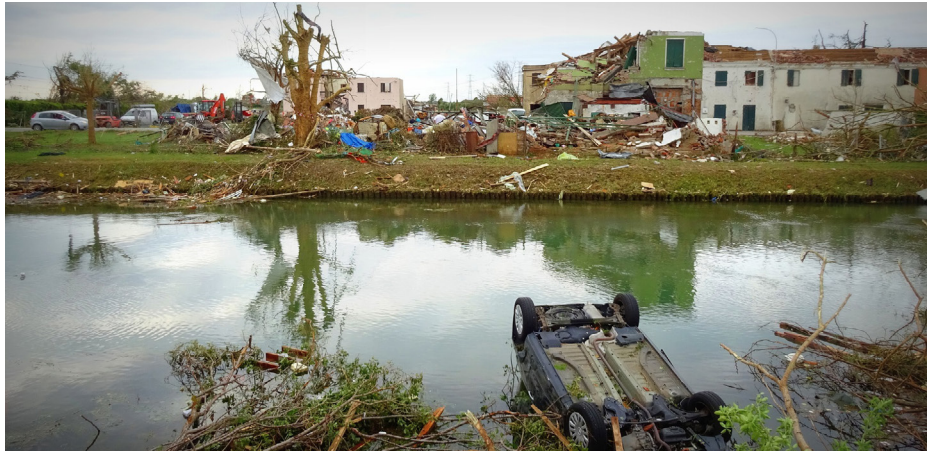
Wieviel Schutz vor Naturkatastrophen ist möglich und gesellschaftlich gewünscht?

Zu Beginn der Tagung dreht sich alles um den Themenkomplex Erscheinungsformen von und Handlungsbedarfe bei Katastrophen sowie um die resiliente Entwicklung von Landschaften. Eine Diskus-