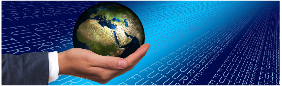
Ökologische und digitale Transformation macht die Welt zukunftsfähig.

Im Frühjahr haben wir 12 Forderungen für mehr Nachhaltigkeit am Bau formuliert - und großen Zuspruch erhalten. Wir haben mehrere Digitalforen zum Thema durchgeführt - mit sehr hohen Teilnehmerzahlen. Wir haben Kooperationen ini-