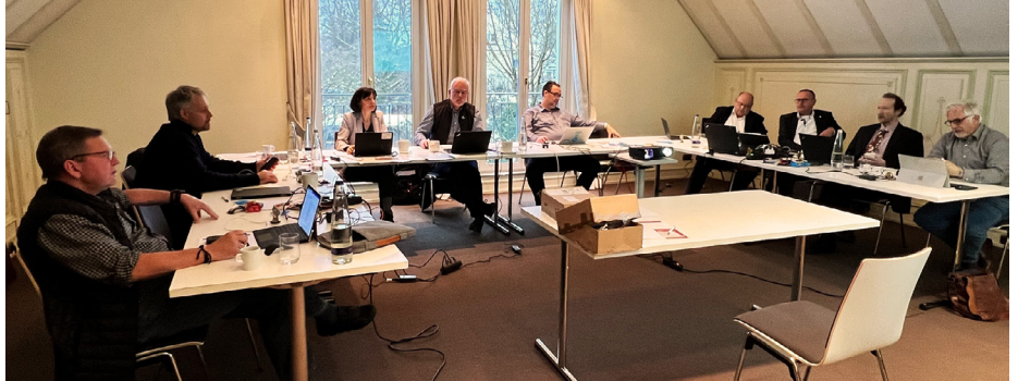
Vorstand und Hauptgeschäftsführung bei der Klausurtagung.