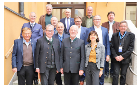
Intensiver Austausch: Freie Wähler und Kammer

Gespräche mit Bündnis 90/Die Grünen, FDP und CSU sind bereits fixiert.