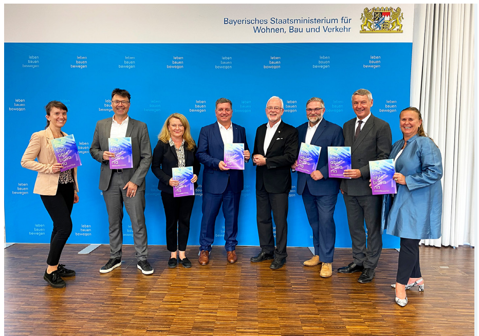
Im September 2022 übergaben Vertreterinnen und Vertreter des Bündnisses Sustainable Bavaria dem Bayerischen Bauminister Christian Bernreiter ihren Maßnahmenkatalog.

Sie sehen: Die vorgeschlagenen Maßnahmen der Baubranche stellen eine gute Grundlage für die weiteren Überlegungen der Staatsbauverwaltung dar. Die Themen unterliegen aber einem dynamischen Prozess, der durch den offenen Dialog mit der Baubranche noch effektiver werden kann. Deshalb werden wir die Maßnahmen in den Arbeitsgruppen des Runden Tisches weiter begleiten, wodurch Umsetzungshindernisse frühzeitig