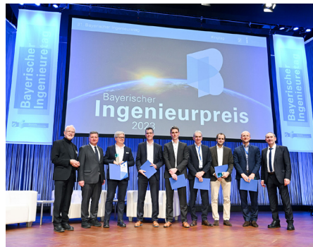
Die Gewinner des Bayerischen Ingenieurpreises.