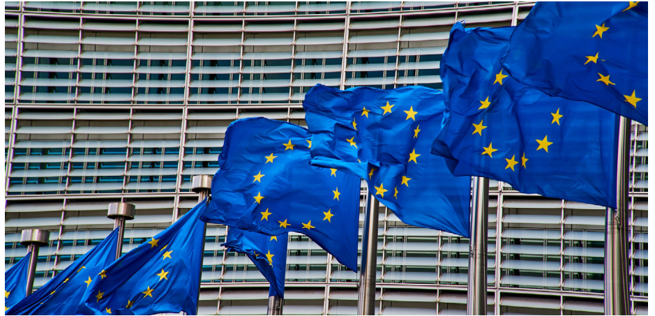
Nach 28 Jahren ohne Anpassung sollen die Schwellenwerte im Vergaberecht angehoben werden.

Der Bundesrat begründet seine Aufforderung an die Bundesregierung damit, dass die seit 28 Jahren beinahe unverändert geltenden Schwellenwerte dringend reformbedürftig seien. Aufgrund der deutlichen Verteuerung insbesondere von Bauleistungen sowie der aktuell hohen Inflation müssten staatliche Auftraggeber für immer kleinere Bau- und Beschaffungs-