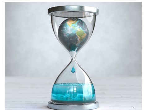
Ökologischer Umbau - die Zeit läuft.

Anmeldungen sind bis 31. März über die Kammer-Homepage möglich.